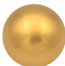
APL23222 Желтое золото