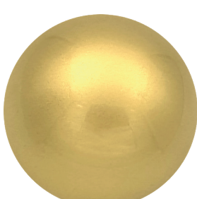
APL23225 Лимонное золото