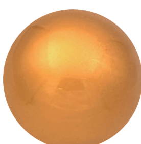
APL23251 Янтарное золото