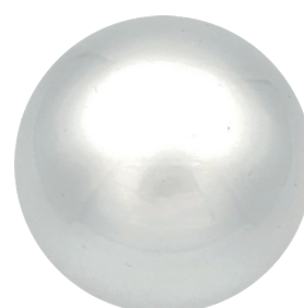
APL22167 Белое золото