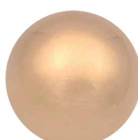
APL23221 Медное золото