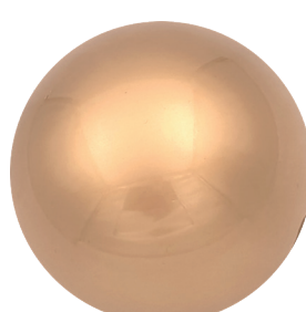
APL23220 Красное золото