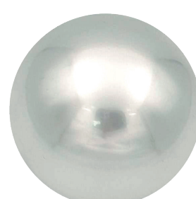
APL21081 Спецэффект Хром